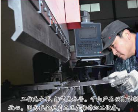
工作无小事,细节无轻重,千山产品细节控制,让客户放心。因为保全员工正在操作加工设备。

在竞争激烈的商海中,想要占领先机,保持优势,让竞争对手知难而退,我们可以在自己身上多“下功夫”,不断完善细节,以细节取胜,从而让企业长期保持强有力的竞争力。这就是我们平时常说的,“细节决定成败”。